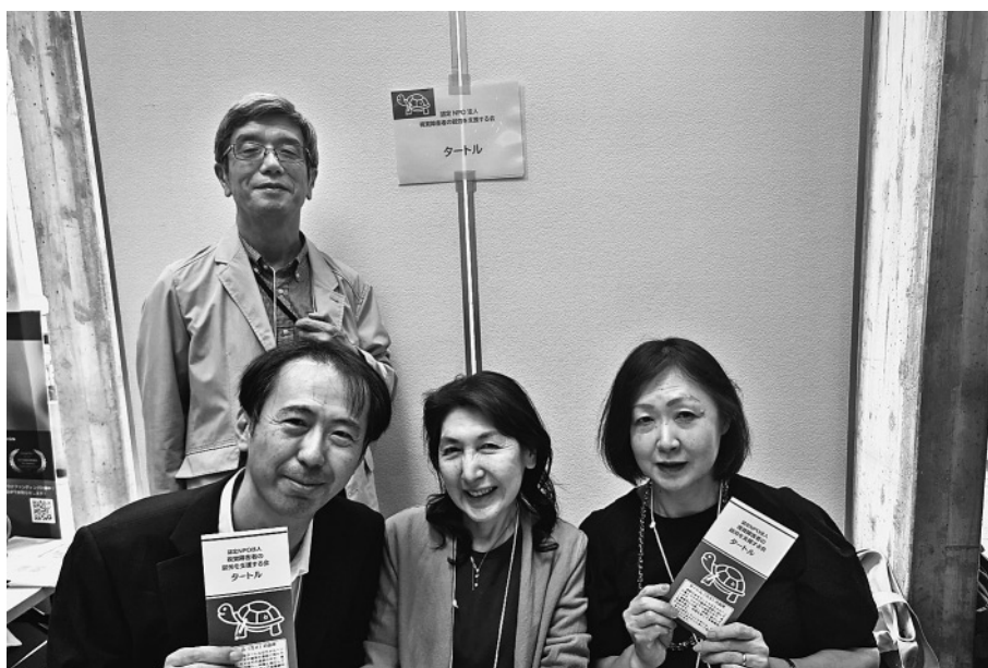
日本ロービジョン学会学術総会の展示ブースにて、理事・運営委員